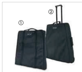
1. Tragetasche extra flach, Art.-Nr. JTTD, EUR 120,- 2. Transporttasche mit Rollen und Teleskopgriff, Art.-Nr. JRT-2, EUR 140,-