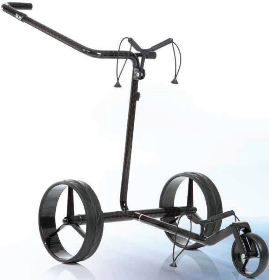
JuCad Carbon Drive