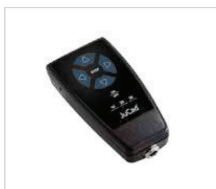
Auf Wunsch noch mehr Fahrspaß mit der JuCad Fernsteuerung, Art.-Nr. JFS, EUR 390,-.