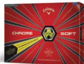
TRUVIS - GELB/SCHWARZ