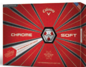
TRUVIS - WEISS/ROT