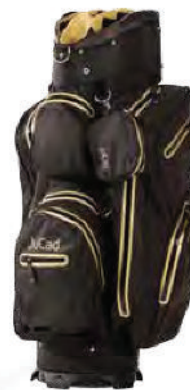
schwarz-gold Art.-Nr. JBA-SRGO