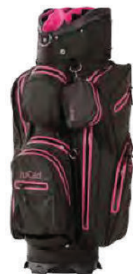
schwarz-pink Art.-Nr. JBA-SRP